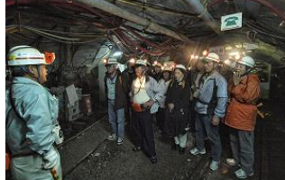
▲トロッコ下車後は元炭鉱マンがご案内