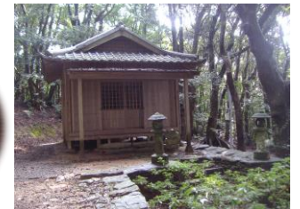
▲枯松神社(キリシタン神社)