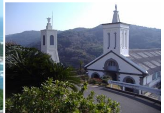
▲出津文化村「出津(しつ)教会」 明治15年ド・ロ神父の設計施行で建てられた教会で周辺には、ド・ロ神父記念館や歴史民俗資料館などもあります。 (注)ミサなどにより教会内に立入できない場合もございます。