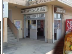
▲池島炭鉱さくら倶楽部 (当時の写真展示コーナーなども)