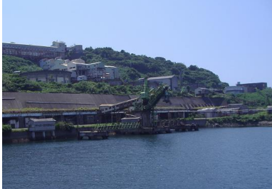
▲池島港より 石炭積み込み機など