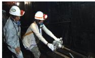
▲穿孔(せんこう)機械操作体験