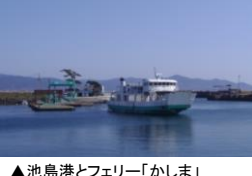
▲池島港とフェリー「かしま」