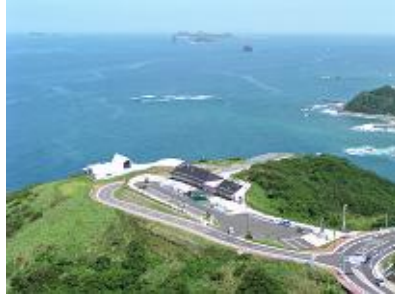
▲外海の風景 (道の駅「夕陽が丘」とめと角力灘)