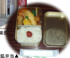
懐かしの池島炭鉱弁当▲