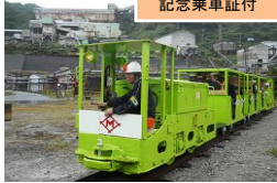
▲トロッコ電車 (片道300m乗車)